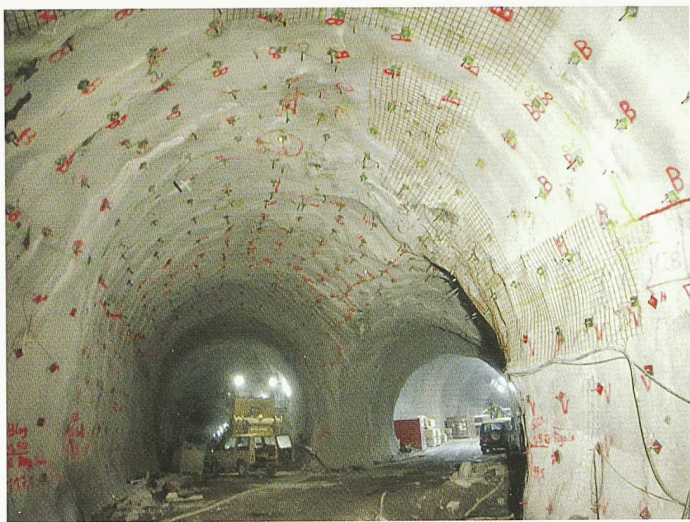
Felssicherung in der Multifunktionsstelle Faido des Gotthard-Basistunnels