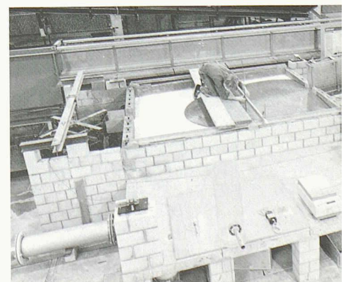
Physikalische Modellierung von Murgängen an der Versuchsanstalt für Wasserbau, Hydrologie und Glaziologie (VAW) der ETH Zürich: Ausbreitungsversuche zur Kalibrierung von Modellfluiden