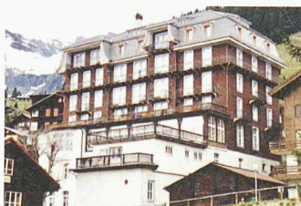
Bauzeugen als Attraktion im Skort Mürren: Hotel «Alpina + Edelweiss», neue Sachlichkeit im Hochgebirge von Arnold Itten, 1927 (ganz oben); Schulhaus Gimmelwald, alpiner Historismus im Ständerbau von 1904 (links); Hotel «Regina», Heimatstil von 1911 (rechts)