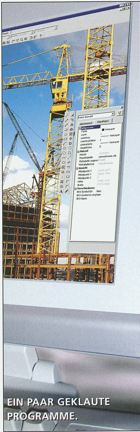
EIN PAAR GEKLAUTE PROGRAMME.