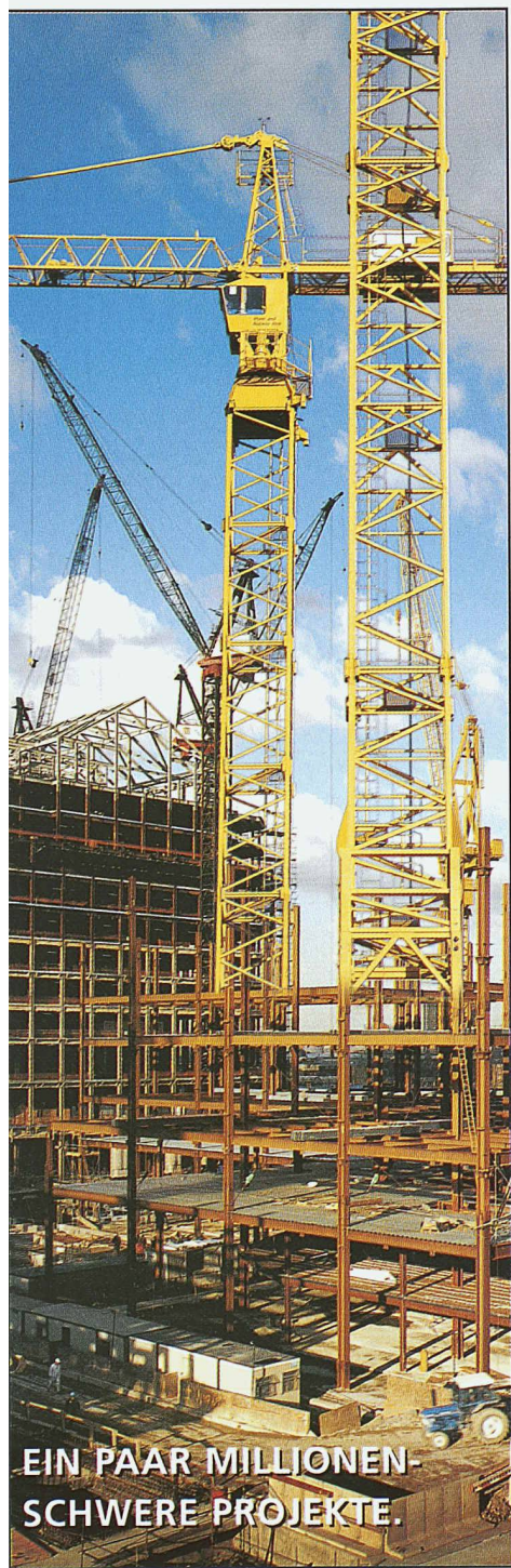
EIN PAAR MILLIONEN- SCHWERE PROJEKTE.