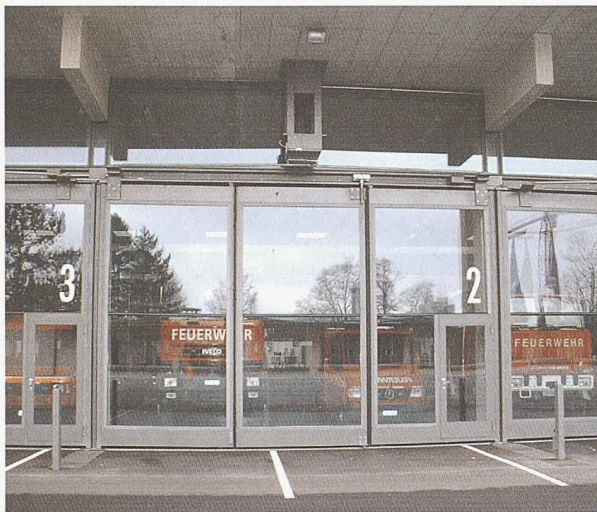
grösste verglaste Falltortflügel Europas

Darf es auch einmal ein schönes Tor sein ?