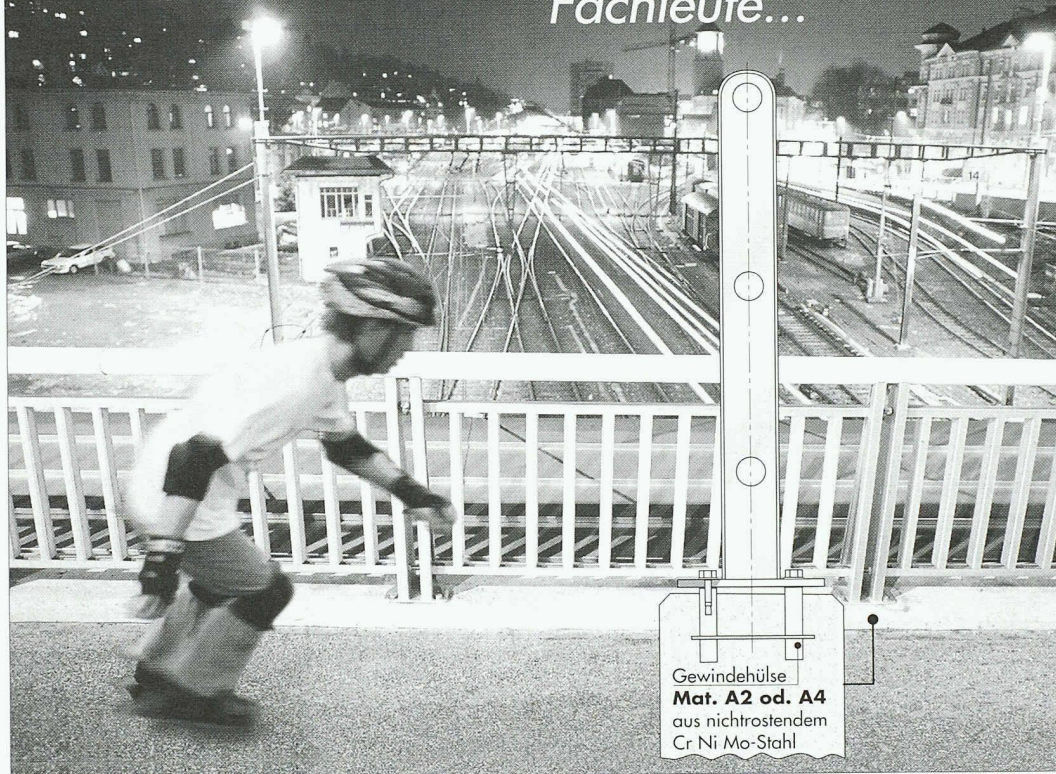
Gewindehülse Mat. A2 od. A4 aus nichtrostendem Cr Ni Mo-Stahl