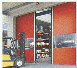
Schnelllauf-tore mit flexiblem Behang