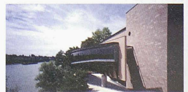
Museum Jean Tinguely, Basel, von Mario Botta, 1996 eröffnet. Oben: Westfassade mit Brunnen von Christian Baur Unten: Südfassade mit «Barca» von Pino Musi