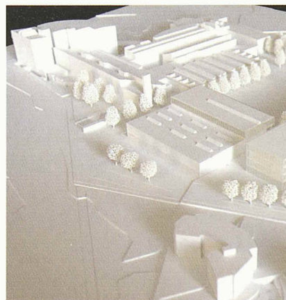
Modell für einen Architekturwettbewerb. Die mit der Beurteilung der Projekte betrauten Jurymitglieder müssen von allen Wettbewerbsteilnehmern unabhängig sein. Darin, wie dies erreicht werden soll, widersprechen sich allerdings die SIA-Wettbewerbsordnung und das öffentliche Beschaffungsrecht

Dies allerdings zieht erhebliche praktische Schwierigkeiten nach sich, wenn es an die Bestellung eines Preisgerichtes geht. Denn die Fachleute, die dort Einsitz zu nehmen haben, sind per definitionem im gleichen Bereich tätig wie die Teilnehmer. Dazu kommt, dass