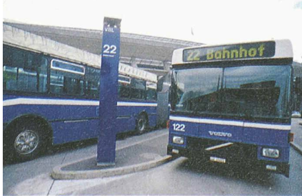
Öffentlicher Verkehr in Luzern