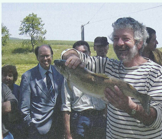
Ein Prachtsexemplar einer Forelle als Beweis für die erfolgreichen Renaturalisierungsmassnahmen am Arnon