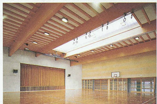
Der Fortbildungskurs Norm SIA 265 ist speziell auf Tragwerksplaner zugeschnitten. Oben: Gemeindezentrum Avusy, Athenaz (Baujahr 2001). Architekten: Carlo Steffen & Gérald Berlie, Carouge

kungen auf Tragwerke (Norm SIA 261) behandelt. Die Fortbildungskurse bilden so für alle Bauingenieure den idealen Einstieg in die neuen Normen respektive in die Holzbauplanung. Der Kurs besteht aus zwölf Lektionen, die sich auf drei Abende oder 1 1/2 Tage verteilen. Als Kursunterlage wird eine umfassende Beispielsammlung abgegeben. Auskunft und Anmeldung: Hochschule für Architektur, Bau und Holz Biel, 032 344 03 18, claudia.stucki@swood.bfh.ch, oder unter www.lignum.ch, Funktion/Veranstaltungen/Weiterbildung.