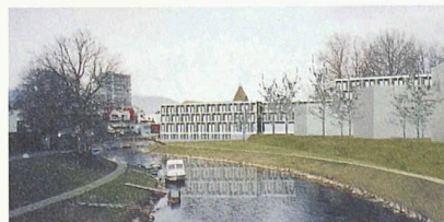
Der Blick von der Thièle, rechts im Vordergrund die Wohnbauten (1. Rang, Büro B)