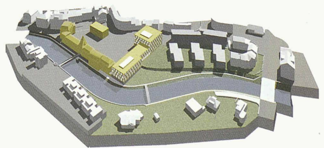
Für den neuen Platz links werden die bestehenden Bauten mit einbezogen (1. Rang, Büro B)