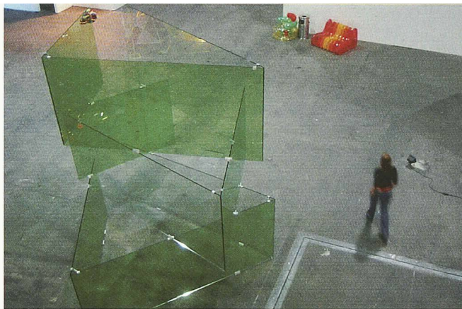
Buchner Bründler Architekten fügen 9 Scheiben zu einem Glasturm zusammen

Jean-Gilles Décosterd und Philippe Rahm – grösseren Kreisen bekannt durch ihr Hormonarium an der Architekturbiennale in Venedig – stellten in Basel ein Projekt mit Modell und Plänen aus. Das Projekt, in der Präsentation ganz konventionell, ist aussergewöhnlich. Das Winterhaus für Fabrice Hybert erhält seine Form aus den Bedingungen, welche die Haustechniker stellen, damit auf Wunsch ein tropisches Klima hergestellt werden kann. Im Keller gedeihen unter künstlichem Licht unzählige exotische Pflanzen und Mikroorganismen, mit deren Hilfe die Luft aufgearbeitet wird, die in den Wohnraum gelangt. Das Haus soll nächstes Jahr in Frankreich fertig gestellt werden. Stadtutopien gibt es viele. Christian Waldvogel geht einen Schritt