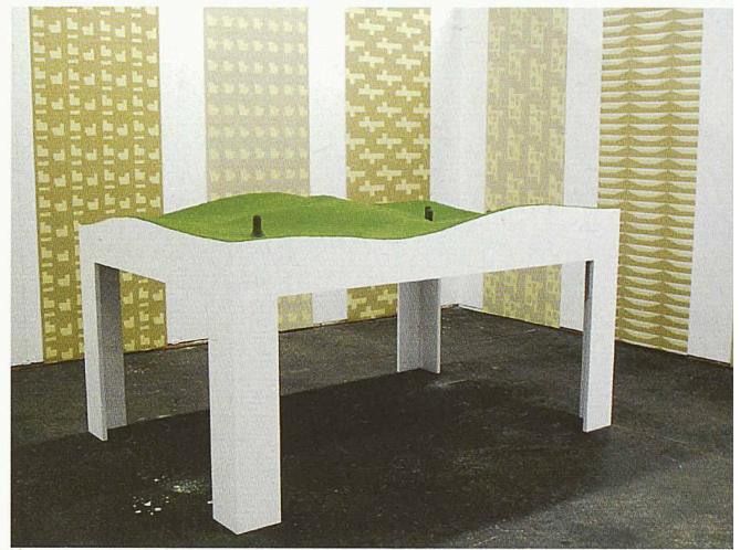
Die Architekturbeiträge sind der Kunst so nahe, dass sie auch Kunst sind. Eine von 4 ausgezeichneten Arbeiten: der «Raum mit Tisch» von Müller Sigrist Architekten

Was Architektur ist, bestimmen die Teilnehmenden selbst, indem sie sich für den Architekturwettbewerb anmelden. Die Altersgrenze liegt bei 40 Jahren. In der ersten Phase bewirbt man sich mit einem Dossier. Teams sind zugelassen. Die Kunstkommission wählt zusammen mit den Architekturexperten nicht Projekte aus, sondern Personen, von denen sie sich einen interessanten Beitrag erhofft. Dieses Jahr bewarben sich 84 Einzelpersonen und Teams im Bereich Architektur, davon wurden 27 für die zweite Runde eingeladen. Bei den nun 4 ausgezeichneten Arbeiten fällt auf, wie unterschiedlich sie sind.