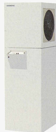
Kompakt-Luft/Wasser Wärmepumpe LIC