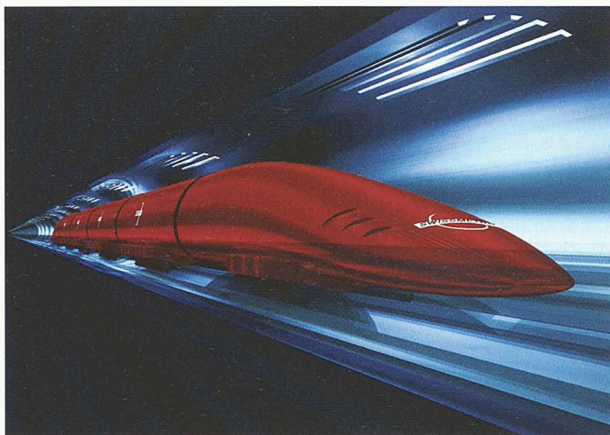
Ein unterirdischer Hochgeschwindigkeitszug soll nach dem Willen der Swissmetro AG dereinst Genf und Lausanne verbinden