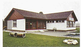
Alfred Roth (1903–1998) und sein Kindergarten in Wangen an der Aare

«Baukultur entdecken» gratis bei: Schweizer Heimatschutz, Postfach, 8032 Zürich, www.heimatschutz.ch