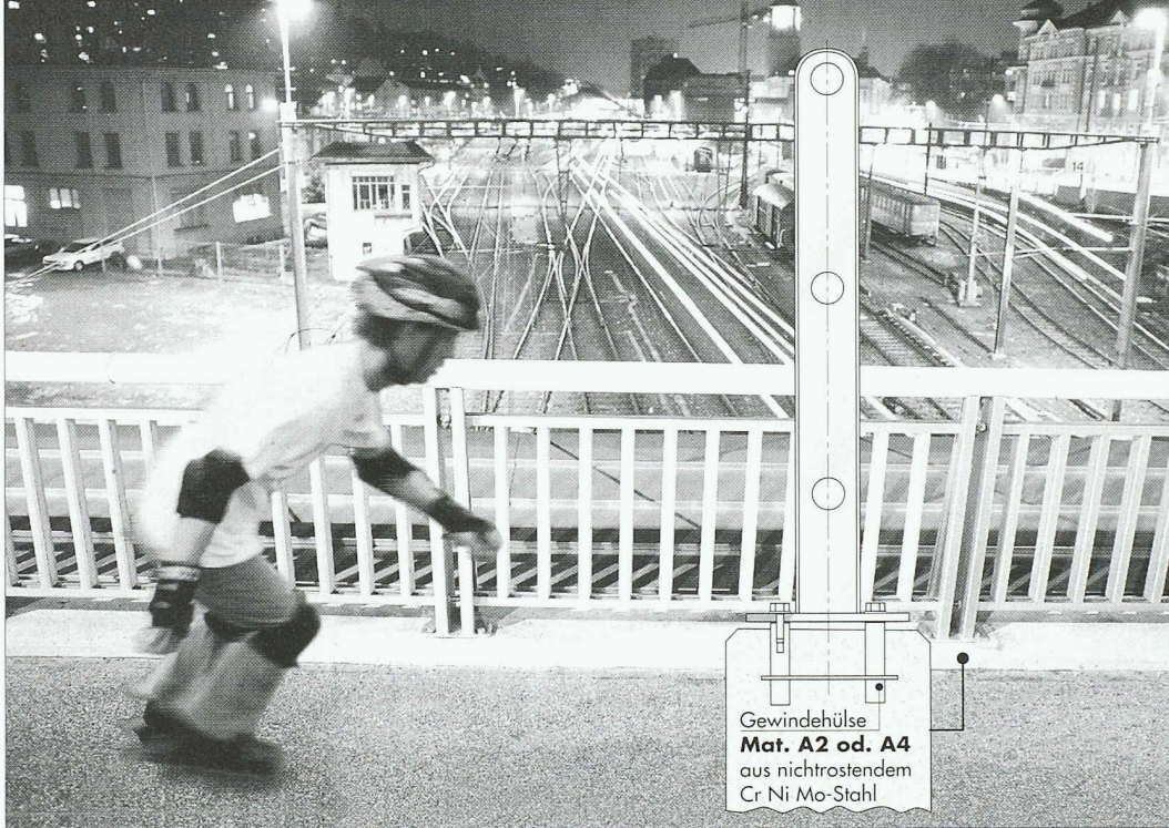
Gewindehülse Mat. A2 od. A4 aus nichtrostendem Cr Ni Mo-Stahl