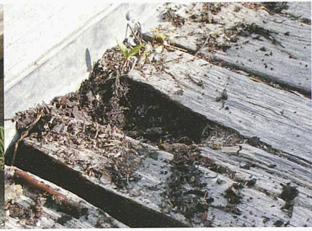
Genügender Abstand zwischen Holz und Boden verhindert die Befeuchtung durch Erde und Pflanzen