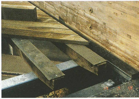
9 Trennschichten, um Feuchtschäden zu verhindern