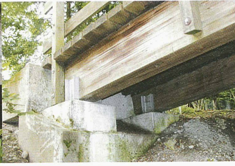
Pflanzen verzögern nach einer Schlechtwetterperiode die Austrocknung des Holzes