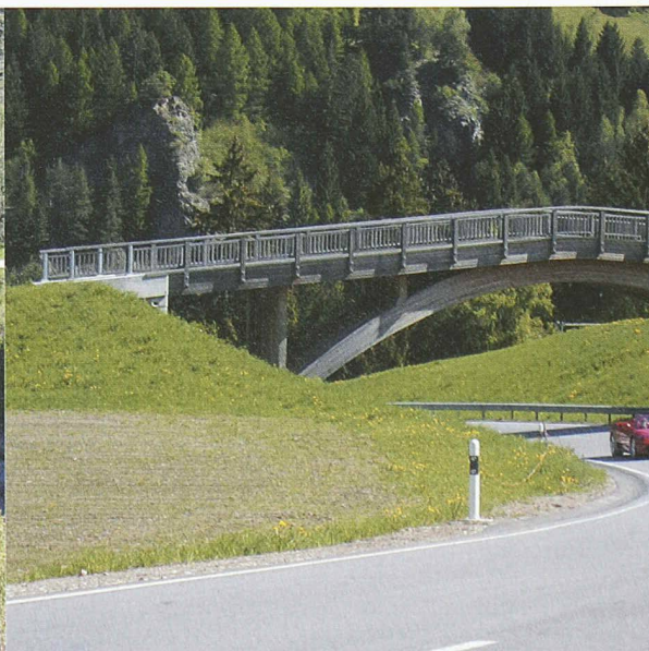
Das Dach bietet einen guten konstruktiven Holzschutz, Ramosch (GR)