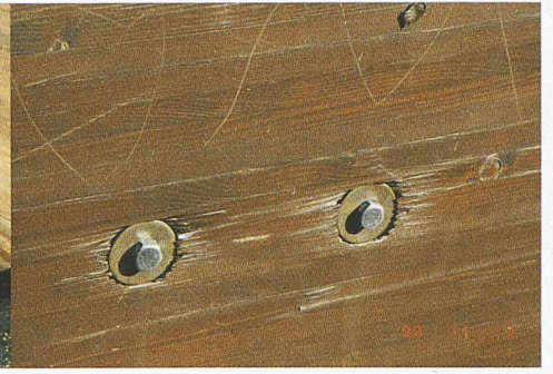
10 Verletzung der Holzoberfläche durch zu starkes Anziehen der Schrauben