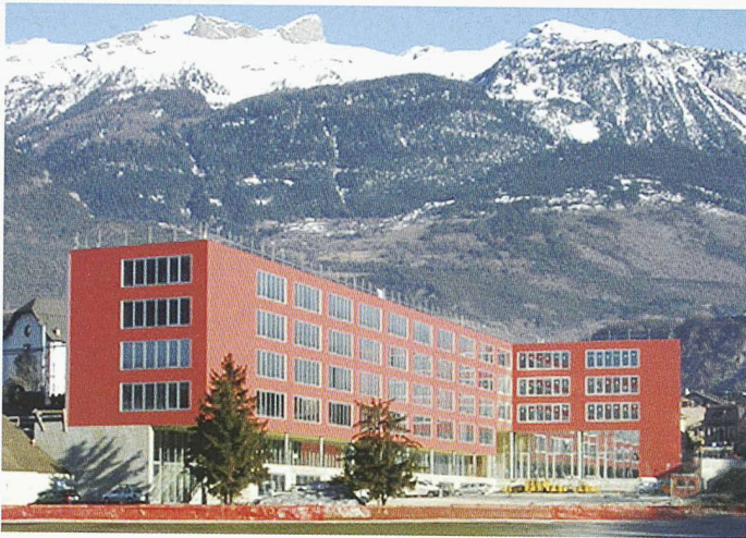
Beim Neubau der Fachhochschule beim Bahnhof Siders blieben die Kosten dank SIA-Garantievertrag im budgetierten Rahmen