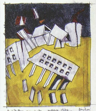
«Architettura Assassinata» von Aldo Rossi

in Modena, aber auch Entwürfe für Rathäuser, Schulen und Wohnbauten werden dokumentiert. Öffnungszeiten: Di–So von 10–17 h, Mi von 10–20 h. Infos: Deutsches Architektur Museum, Frankfurt am Main, +49 69 212 388 44 oder www.dam-online.de .