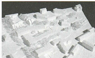
Die Wohnungen sind mäanderartig durch Wohnräume erschlossen (Baumann Roserens, 1. Rang)