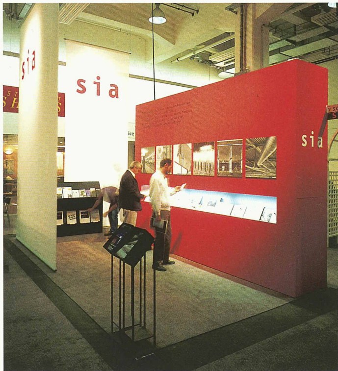
Mit seinem Stand präsentierte sich der SIA als kompetenter, seriöser und sachlicher Partner

Nachhaltigkeit nicht ausschliesst. Die Entwicklung läuft auf bessere Fassaden hinaus, so dass für die Haustechnik weniger Aufwand erforderlich ist und damit letztlich geringere Betriebskosten anfallen. Allerdings ist dafür eine gute und frühzeitige Koordination zwischen Architekt und Haustechnikplaner Voraussetzung. Anhand von Vorzeigeobjekten, an denen er beteiligt war, skizzierte er das Ziel der Gebäudehülle als Kraftwerk.