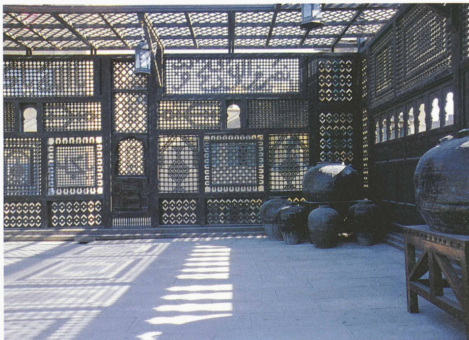
Das kunstvolle Holzgitter (Muscharabya) wirkt wie eine textile Fassade

Die Ausstellung im Vitra Design Museum in Berlin dauert bis am 18. Januar 2004. Der Katalog kostet in der Ausstellung 39, im Buchhandel Euro 59,90.