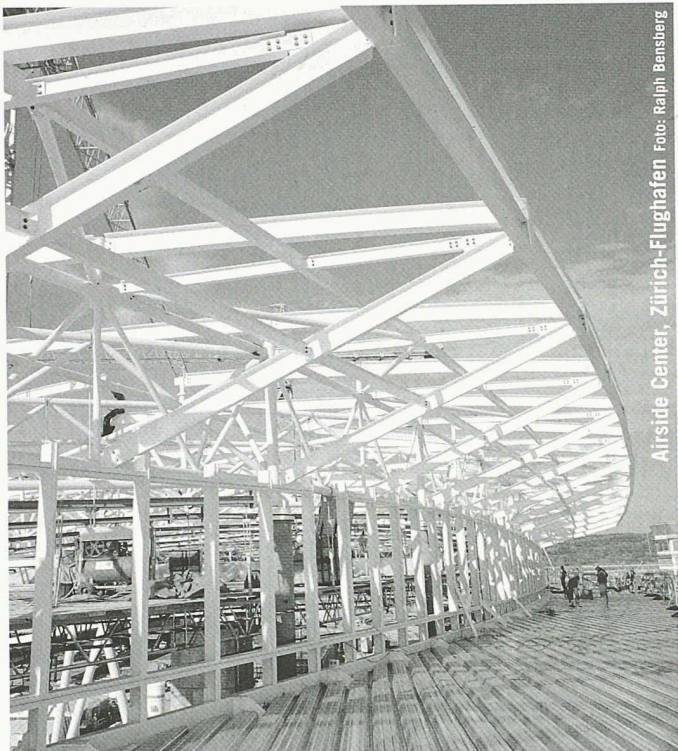
Airside Center, Zürich-Flughafen

Partner für anspruchsvolle Projekte in Stahl und Glas