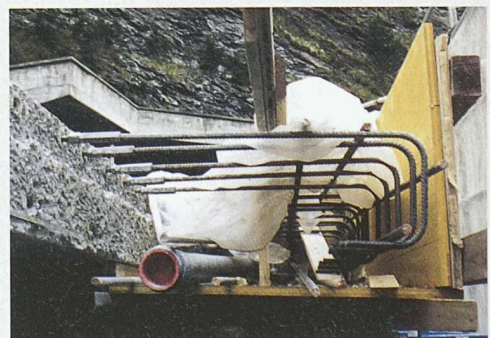
Instandsetzung 1998/99 der Viamala-Brücke, A 13 Chur–San Bernardino–Bellinzona; Ersatz der Konsolköpfe