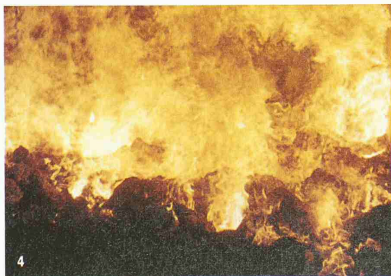
4 Feuer auf dem Rost einer KVA

Anlage betrieben und erzielt dadurch einen deutlich besseren Wirkungsgrad. «Wenn sich diese Technologie im harten Betriebsalltag bewährt, dann kommt das einem Quantensprung gleich», erklärt Peter Steiner vom Branchenverband VBSA (Verband der Betriebsleiter und Betreiber Schweizerischer Abfallbehandlungsanlagen).