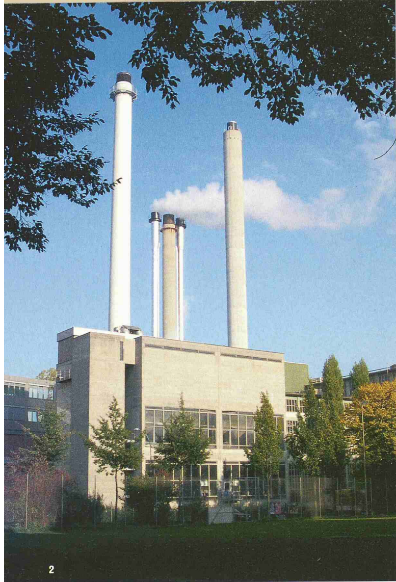
2 Fernwärmezentrale und KVA Bern