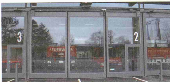
Wälty & Co. AG Die Tormanufaktur seit 1848 CH-5040 Schöftland/Aarau