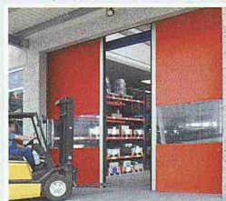
Schnelllauf-tore mit flexiblem Behang