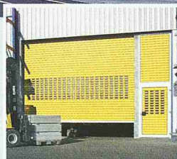
Hörmann Rolltore, jetzt auch als «Speed» Version