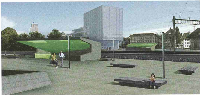
Auf der verbreiterten Plattform ist der Abgang zur vorgeschlagenen Ladenpassage unter den Gleisen sichtbar (1. Rang, Müller & Truniger)

(bö) Gleich beim Bahnhof Winterthur kreuzen sich die Zürcherstrasse und die Gleise. Einfach war die Neugestaltung dieser Gleisquerung nicht. Die verschiedenen Anforderungen des Verkehrs, der Fussgänger, der Velofahrer, der SBB (Perronzugang) und der Zulieferer mussten unter einen Hut gebracht werden. Der Vorschlag sollte etappierbar sein und sowohl heute funktionieren als auch im Hinblick auf die zwei laufenden Planungen auf beiden Seiten der Unterführung. Auf die komplexe Aufgabe antworteten die Verantwortlichen mit einem offen und anonym durchgeführten Ideenwettbewerb. Fachleute aus den Bereichen Städtebau, Architektur, Landschaftsarchitektur und Ingenieurwesen konnten Konzepte im Massstab 1:500 und 1:1000 vorlegen. Dabei ging es nicht nur um die Verbindungen quer zu den Gleisen, sondern auch längs dazu. 27 Büros trauten sich die Aufgabe zu.