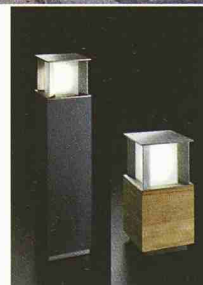
BRIDGE 15 EXTERIOR LIGHTING / AMBIENCE LIGHTING / DESIGN DELTA LIGHT

www.delta-light.ch the bright side of light