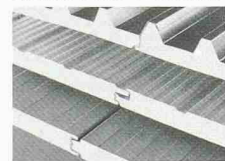
DAWATHERM Isolations-Sandwichpaneelen für rationelles Bauen