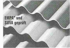
EMPA* und SUVA geprüft DAWANIT Faserzement-Wellplatten in neuester Technologie