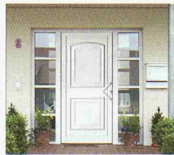
TopComfort Haustüren: über 300 Motive... Sie haben die Wahl!