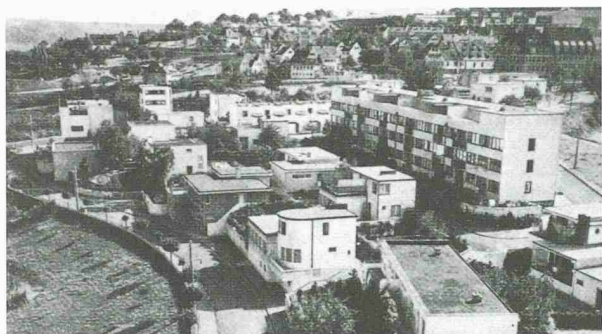
1927 als «Araberdorf» und «schwäbisch Marokko» verspottet, heute internationales Baudenkmal: Die Weissenhof-Siedlung in Stuttgart gehört zum Tafelsilber der modernen deutschen Baugeschichte (Bilder aus J. Joedicke: Weissenhofsiedlung)