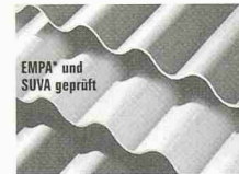
EMPA* und SUVA geprüft DAWANIT Faserzement-Wellplatten in neuester Technologie