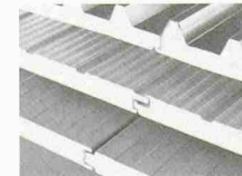
DAWATHERM Isolations-Sandwichpaneelen für rationelles Bauen