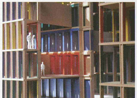
Burkard, Meyer Architekten, Baden. Schule für Berufsbildung, Baden, 2003–2006, Modellfoto