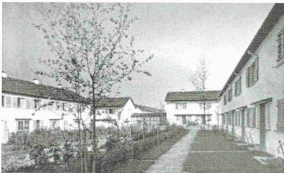
Die Reihenhäuser der Siedlung Katzenbach in Zürich Seebach von Sauter und Dirlir von 1944/45 (rot markiert) weichen Wohnungen von Zita Cotti