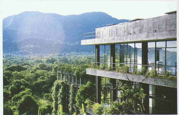
Kandalama Hotel Dambulla (1991) von Geoffrey Bawa. Das Deutsche Architektur Museum zeigt ab 24. Juli die Ausstellung: «Bawa – Genius of the place. An Architect of Sri Lanka.»

Häuser greifen in die Landschaft hinein, die Natur verbindet sich mit einem Bau zu einem eigenen Raum. Geoffrey Bawa starb 2003. Das Deutsche Architektur Museum (DAM) in Frankfurt am Main zeigt in einer grossen Ausstellung erstmals das gesamte Werk Bawas, in Plänen, Fotos, Modellen, Filmen und Möbeln. Die Ausstellung inszeniert das originale Ambiente mit Stoffen, Kunst und Materialien aus Sri Lanka. Sie beginnt am 24. Juli und dauert bis 17. Oktober. Öffnungszeiten: Di–So 10–17 h, Mi 10–20 h. Führungen: Sa + So, 15 h. Infos: www.dam-online.de oder Tel. +49 69 21 23 88 44.