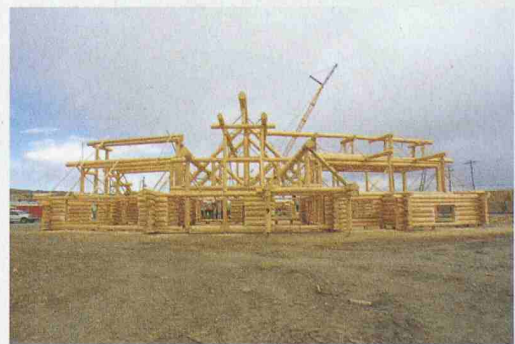
Die traditionelle Blockbauweise wird in Kanada immer noch praktiziert und weiterentwickelt

Die Holzbaureise findet statt vom 23. bis zum 30. Oktober 2004. Die Anmeldung ist möglich bis Ende August bei Werner Naef von der kanadischen Botschaft in Bern. Telefon 031 357 32 06. werner.naef@dfait-maeci.gc.ca