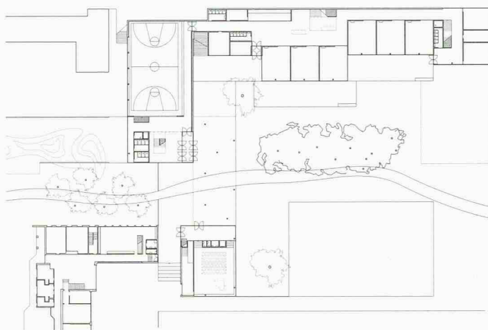
Situation, Erdgeschoss und Visualisierungen der geplanten Schulerweiterung: plastisch gestalteter Winkel mit mäanderförmigen Innenräumen (1. Preis, Regula Harder + Jürg Spreyermann)