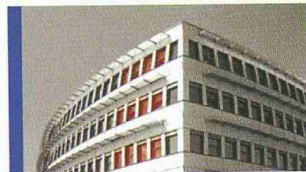
Weniger Energieverbrauch — Besseres Raumklima

Intelligenter isolieren. Abstandhalter und Sprossen aus Kunststoff für Isolierglas.