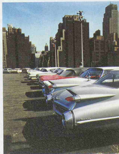
Car Park, New York, 1965

sam mit Schriftstellerinnen und Schriftstellern eine Reihe von Städtebüchern. Die Ausstellung im Aargauer Kunsthhaus über ihr Werk wird am 18. September eröffnet und dauert bis 5. Dezember (Öffnungszeiten: Di–So 10–17 h, Do 10–20 h). Führungen finden an folgenden Daten statt: 28.10., 11.11., 19.11. und 2.12., jeweils 18.30 h. Gleichzeitig zur Ausstellung erscheint eine Monografie: «Evelyn Hofer. Das fotografische Werk». Infos: Aargauer Kunsthhaus, Tel. 062 835 23 30 oder www.aargauerkunsthhaus.ch.