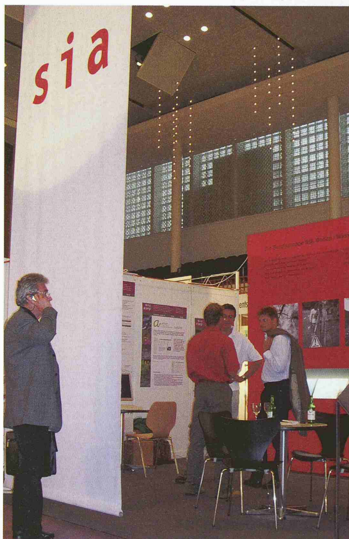
Der Stand des SIA bot den Fachvereinen der Berufsgruppe Boden/Wasser/Luft Gelegenheit, ihre Leistungen zu zeigen und mit Interessenten Kontakte anzubahnen

Die der Berufsgruppe angehörenden neun Fachvereine, nämlich der Bund Schweizer Landschaftsarchitekten und -architektinnen, der Schweizer Geologen Verband, die Fachgruppen für Arbeiten im Ausland, für Brückenbau und Hochbau, für Untertagbau, der Fachverein der Kultur-, Geomatik- und Umweltingenieure, der Fachverband Schweizer Raumplanerinnen und Raumplaner, der Fachverein Wald und der Schweizerische Verband der Umweltfachleute waren am Stand des SIA vertreten. Dort lag auch der neue Prospekt auf, der das Leitbild der Berufsgruppe sowie den Zweck und die Ziele jedes Fachvereins kurz vorstellt und die Anlaufstellen nennt.