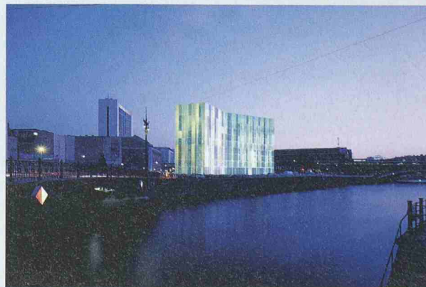
Geschäftshaus Spreedreieck, Berlin, Wettbewerb 2004

werben teilnahm, von denen es 28 gewann. Am 29. Oktober um 18 h hält Roger Diener einen Vortrag über seine Arbeit; Führungen durch die Ausstellung werden bis Mitte Dezember alle zwei Wochen jeweils am Donnerstag um 18 h angeboten. Begleitend zur Ausstellung erschien ein Katalog zum Preis von 14 Euro. Die Ausstellung dauert bis 9.1.05 und ist geöffnet Di–So von 10–17 h, Do + Fr 10–20 h. Informationen: Tel. +49 89 289 22 493 oder Internet: www.architekturmuseum.de.