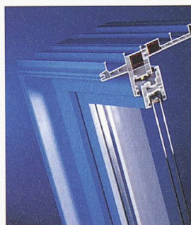
ACO Therm - wärme- gedämmte Leibungsfenster

Mit dem ACO Therm Leibungsfenster ist ein entscheidender Schritt in Richtung wirtschaftliches und ökologisches Bauen gelungen.