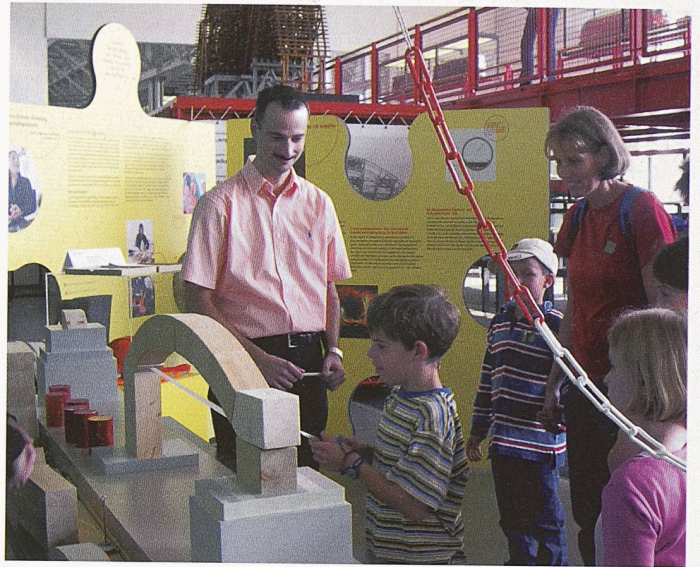
Vorführungen und Experimente wecken das Interesse und geben Anlass zu Gesprächen mit den anwesenden Fachleuten