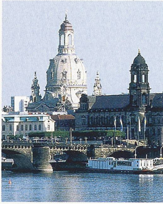
Weiss strahlt die wiederaufgebaute Frauenkirche in der heutigen Stadtsilhouette von Dresden

(co) Am 30.10.2005 wurde die wiederaufgebaute Dresdner Frauenkirche geweiht. Am Gottesdienst nahmen tausende Besucher teil. Der Architekt George Bähr entwarf 1722 die heutige Gestalt der Frauenkirche. Sie wurde in den Jahren 1726–43 erbaut. Bei den Bombenangriffen auf Dresden im Februar 1945 brannte sie aus und stürzte schliesslich ein. Nach einem gescheiterten Wiederaufbauversuch erklärte die DDR die Kirchenruine 1966 zum Mahnmal gegen den Krieg. Erst im Februar 1990, als der «Ruf aus Dresden» von Pfarrer Karl-Ludwig Hoch um die Welt ging, kam es erneut zu Überlegungen zum Wiederaufbau. Im Jahr 1994 gründeten Sachsen, Dresden und die Landeskirche die öffentliche Stiftung Frauenkirche. Rund zwei Drittel der Baukosten in Höhe von 179 Millionen Euro konnten über Spendengelder finanziert werden. Für viele Deutsche ist mit dem Wiederaufbau der Frauenkirche ein Mahnmal zu einem Symbol der Versöhnung umdefiniert worden. Kritiker bezweifeln, dass der Sakralbau in einigen Jahren noch als Nachbau zu erkennen sein wird. Sie befürchten, dass die Frauenkirche ihren Stellenwert als zeitgeschichtliches Denkmal einbüßen wird.