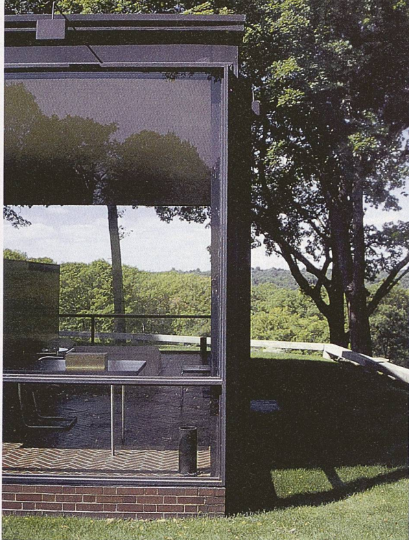
Philip Johnsons «Glass House» in New Canaan von 1949, Zeuge «architektonischer Kleptomanie» (Charles Jencks): Johnson nannte selber 17 Quellen für das Haus, u. a. Le Corbusier (Lageplan), van der Rohe (Durchdringung der Volumen), van Doesburg (asymmetrische Komposition), Schinkel (Symmetrie)