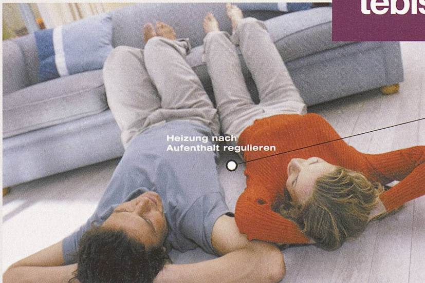
Heizung nach Aufenthalt regulieren