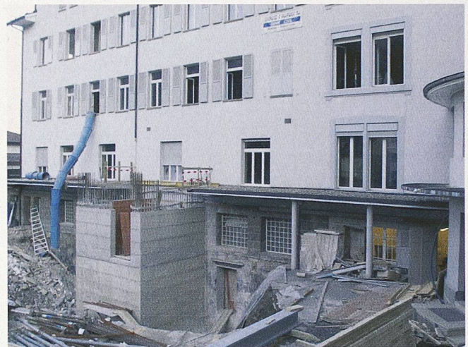
Ein angebauter Liftkern aus Stahlbeton verbessert die Erdbebensicherheit an einem Schulhaus in Monthey VS

Mit den Tragwerksnormen des SIA von 2003 erhielt die Schweiz moderne, dem Stand der Technik entsprechende und europakompatible Erdbebennormen. Weil die SIA-Erdbebennormen noch heute wie in der Vergangenheit oft ignoriert oder nicht vollumfänglich eingehalten werden, ist es sogar bei neueren Bauten nicht immer möglich, allein aus dem Erstellungsjahr zu schliessen, wie weit diese den heutigen Vorschriften für Neubauten entsprechen. Der SIA hat mit dem Merkblatt SIA 2018 Überprüfung bestehender Gebäude bezüglich Erdbeben ein Dokument geschaffen, das erlaubt, die Notwendigkeit von Massnahmen zur Gewähr-