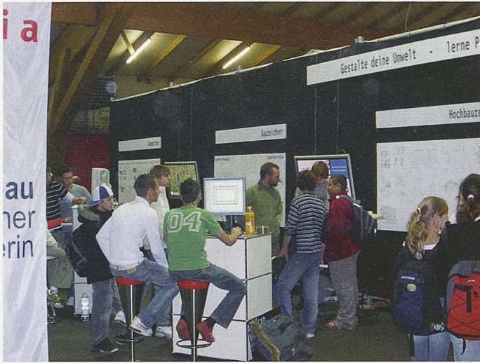
Die Jugendlichen machten am SIA-Stand an der Zentralschweizer Bildungsmesse regen Gebrauch von den Informationsmöglichkeiten, und es entspannen sich zahlreiche ernsthafte Gespräche