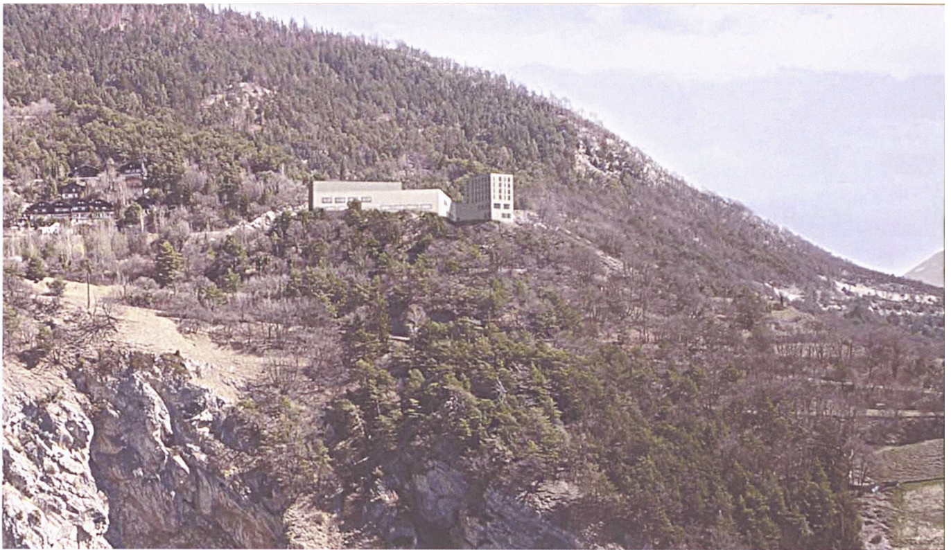
Kongresszentrum Leuk an exponierter topographischer Lage