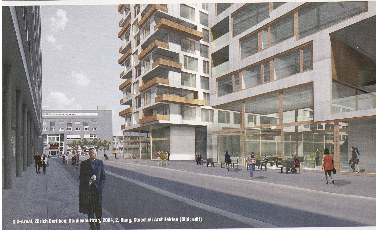
GIS-Areal, Zürich Oerlikon. Studienauftrag, 2004, 2. Rang, Stuecheli Architekten