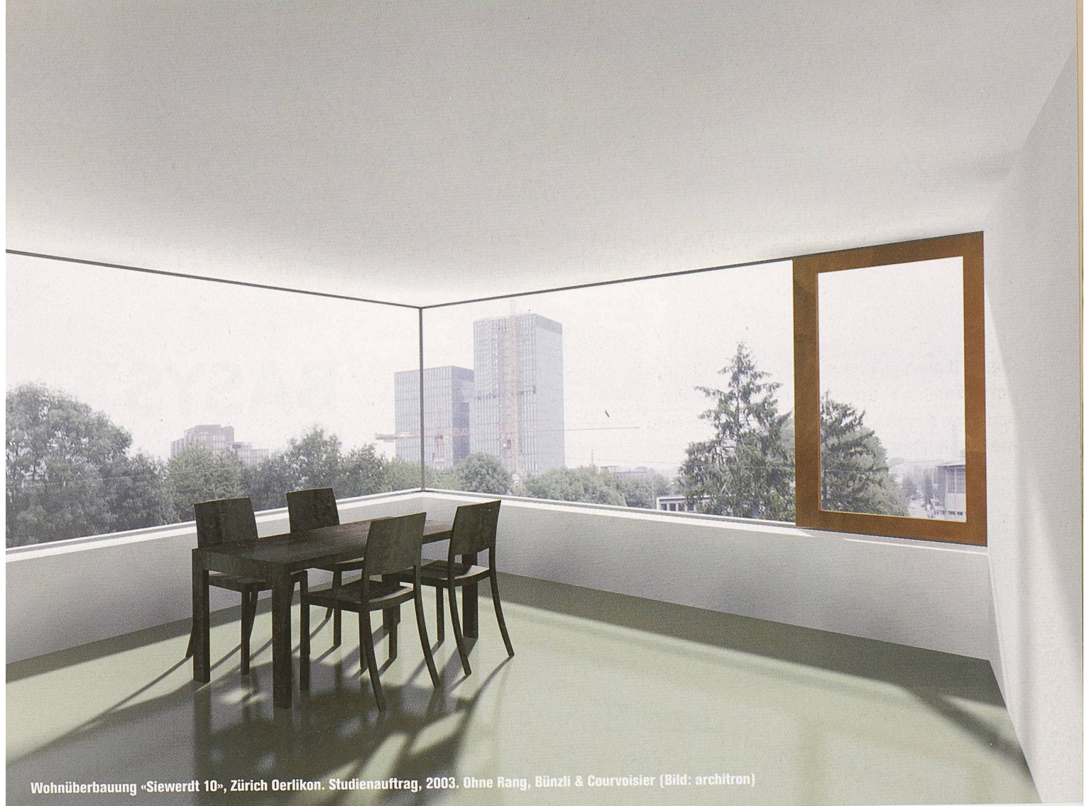
Wohnüberbauung «Siewerd 10», Zürich Oerlikon. Studienauftrag, 2003. Ohne Rang, Bünzli & Courvoisier