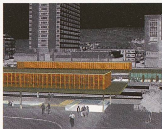
Das erstprämierte Projekt Bahnhofunterführung in Zürich Oerlikon

Energiegeografie: Die Verbreitung von Erdwärmesonden (EWS) in der Schweiz 1998 entspricht eher der Bevölkerungsverteilung als dem terrestrischen Wärmefluss