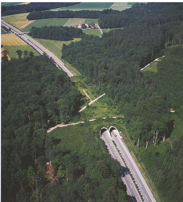
Die Brücke Fuchswies über die Autobahn A 7 bei Kreuzlingen TG dient als Wildwechsel, aber auch der Flora zur Verbreitung

Der grossen Zahl Beschäftigter, die unter zu viel Arbeit leiden, steht die gestiegene Arbeitslosenquote gegenüber. Sie betrug 2004 durchschnittlich 3,9%. Höher war sie letztmals 1997 mit 5,2%. Besonders besorgniserregend ist laut Staatssekretariat für Wirtschaft (Seco) der Anstieg der Jugendarbeitslosigkeit auf 5,1%. Laut Travail.Suisse, Dachorganisation verschiedener Arbeitnehmervertretungen, ist die Arbeitslosigkeit zunehmend strukturell bedingt. Entsprechend fordert sie etwa Aus- und Weiterbildungsmaßnahmen, mehr Lehrstellen und die Verlängerung der Taggelder. Die Schweiz brauche für ein grösseres Wachstum «mehr statt weniger Sicherheit». Und Umverteilung auf Teilzeitstellen?