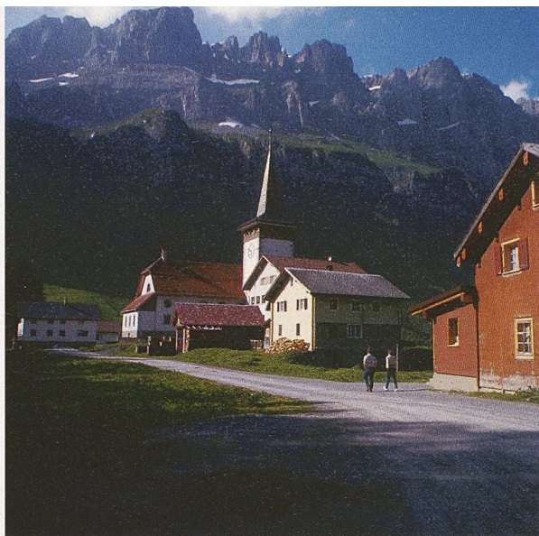
Spittelrüti, Urnerboden. Uri und Glarus gehören zu den Kantonen, die weiter Bevölkerung an die Zentren verlieren werden